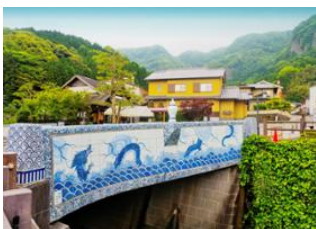
Fukuoka 📍 🚗 200km - ⌚ 3h 30m Nagasaki 📍