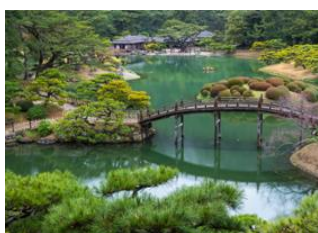
Vallée d'Iya 📍