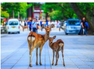
Kyoto 📍 🚗 46km - ⌚ 40m Nara 📍 🚗 46km - ⌚ 40m Kyoto 📍