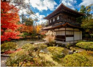
Miyajima 📍 🚗 388km - ⌚ 2h Kyoto 📍